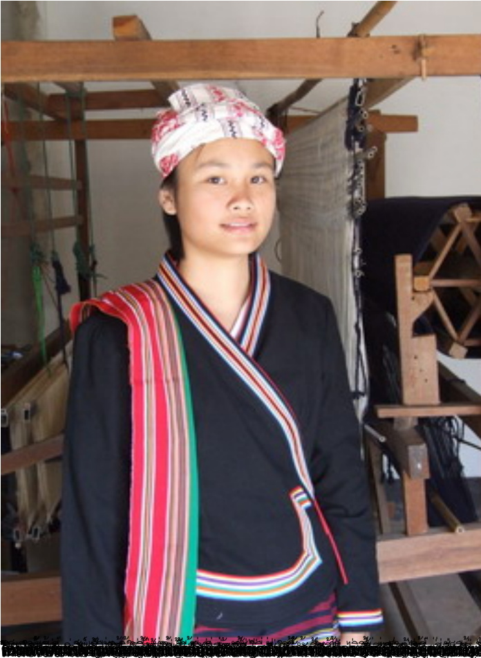
สาวน้อยชาวไทลื้อ (ผู้แต่ง)