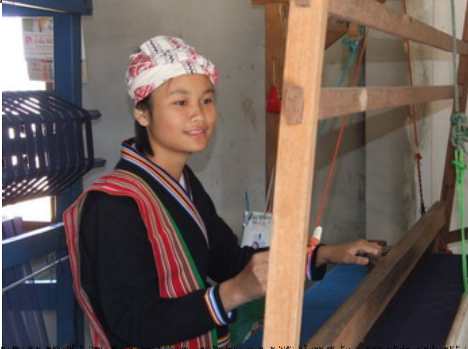
สตรีกำลังทอผ้าไหมในหมู่บ้านที่อำเภอปางงิ้ว จังหวัดลำปาง