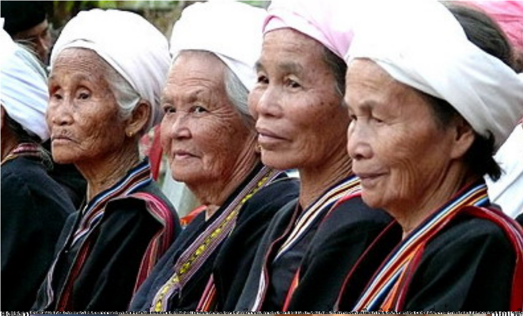
สตรีสูงอายุในหมู่บ้านที่อำเภอปางงิ้ว จังหวัดลำปาง และเชียงใหม่